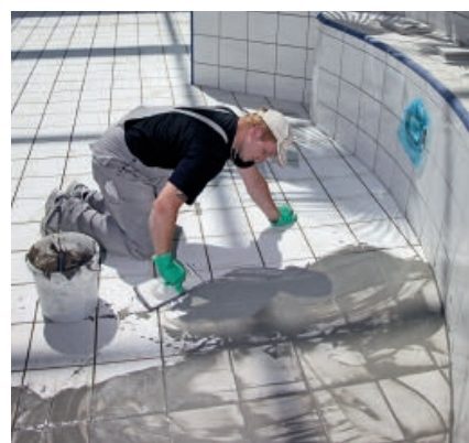
PCI Durafug NT используется для затирки швов керамических покрытий, подверженных повышенному механическому нагрузкам, например, в плавательных бассейнах